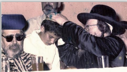
רבינו זי"ע מברך יד אחד מבינוטי "מידי חודש בחודשו". לימינו יושב הגאון הנדון רבי עובדיה יוסף זצ"ל

קשה לתאר את המהפך הרוחני שחוללו מפעלים אלו בכל העיר אשדוד, כאשר אף אלו שלא זכו בפועל להשתתף בכינוסים אלו הושפעו לטובה ע"י חבריהם ושכניהם.