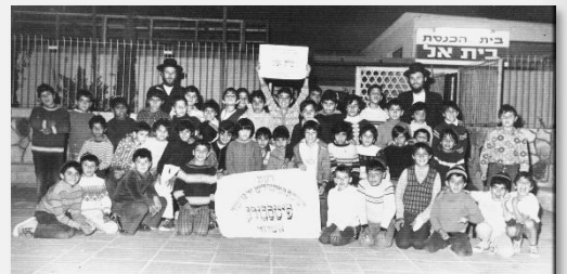
"כמה גדולים מעשי חיאי" - אורגן אשדוד ישיבת המתמידים "יד איתמר" כניהב"ס בית אל - אורגן אשדוד

והפטיר רבינו: "מכך הבנתי שאני צריך להתעסק עם ילדי ישראל, לקרבם לחיק אבינו שבשמים, ולשם כך הקמתי את ארגון 'יד איתמר'".